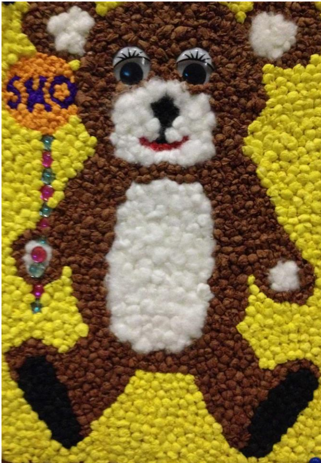
Kontur misia do wykonania pracy plastycznej